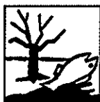
Niebezpieczny dla środowiska